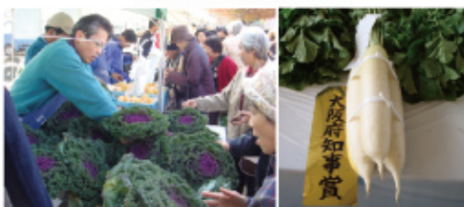
第3回箕面市農業祭。新鮮野菜の即売会には毎年長蛇の列!(芦原公園/11/29土)