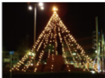
箕面の冬の風物詩 みのお市民ツリー。今年は、箕面駅前会場を移して、駅前ロータリーの噴水の上に12メートルの高さで登場! 12/25まで、箕面の夜を彩ります。(12/7~12/25)