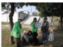
次回は、12/25(水)9:40~サンタのたんけん隊

毎月1回、スタジオを飛び出して、まちのみなさん、まちのいまをライブレポート! 緑のジャンパー(夏は青いハッピー)が目印です。見かけたらぜひ声をかけてください。