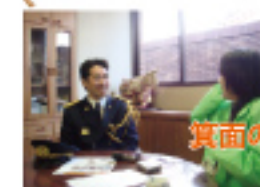
わがまち箕面のリーダー 倉田哲郎市長の行動の軌跡をインタビュー。