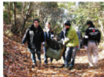
箕面の山パトロール隊が主催する「第5回箕面の山大掃除大作戦」。今年は430名が参加し、山の斜面を中心に、沓蔵庫、テレビ、瓦、タイヤ、便器・など約8トンの不法投棄を回収しました。(12/6土)