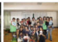
写真(左) 当分検公園でドッグダンスを練習中 パロンくん・ユキちゃんたちと 写真(右) 西小コミセン「星座の家」で子育てサークル「もみじのおでて」のみなさんと