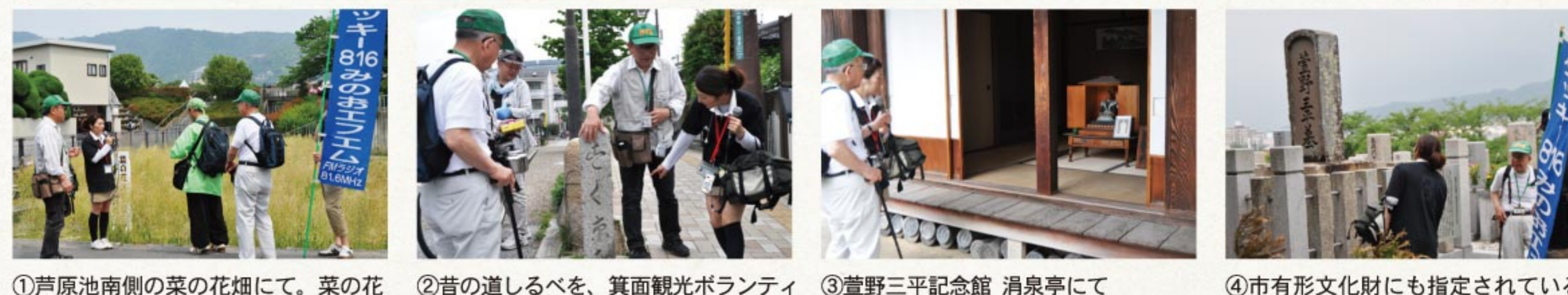
①芦原池南側の菜の花畑にて。菜の花プロジェクトみのおのみなさんと ②昔の道しるべを、箕面観光ボランティアガイドさんに教えてもらいました ③萱野三平記念館 湧泉亭にて ④市有形文化財にも指定されている三平墓碑へ