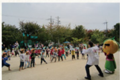
②瀬川保育園のみんなとゆずる体操に トライ！