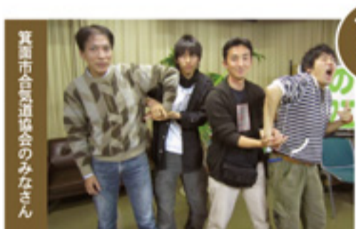
11/3 (祝) エール・マガジン 箕面市合気道協会のみなさん