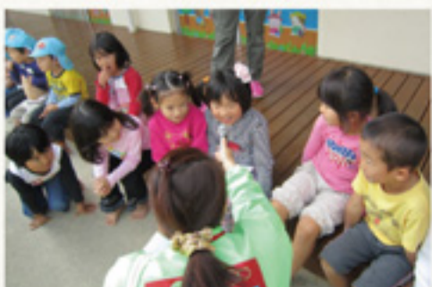
③園児たちにインタビュー