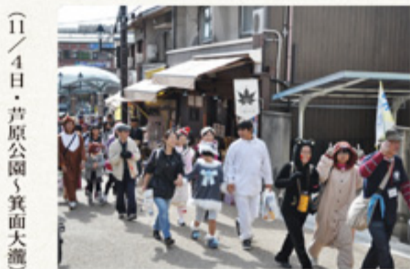
(11/4日・菅原公園) 箕面大瀧

水戸黄門の主題歌「あな人生に涙あり」を合図に、瀧安寺往復の4km・箕面大瀧往復の7kmコースに分かれて出発しました。 このイベントの目玉の1つは仮装ウォーキング。一緒に歩く人を楽しませていました。