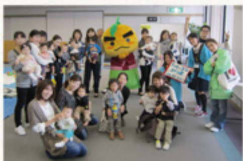
①出張子育て広場（みのおライフプラ ザ）参加者のみなさんと