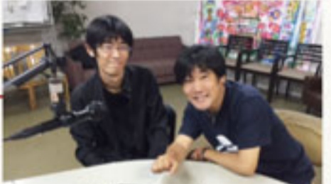
プロ棋士 千田翔太五段(左)