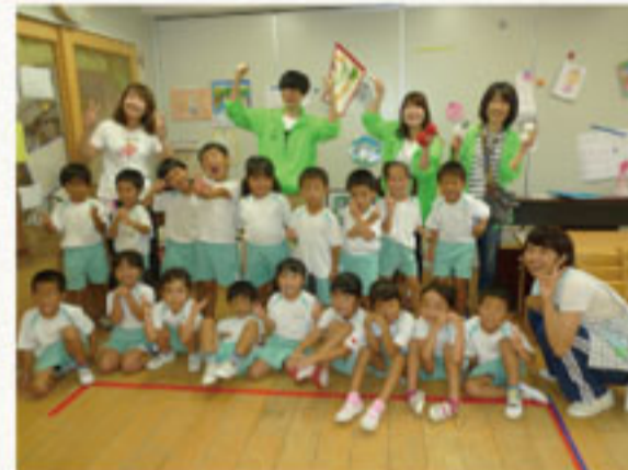
③みんなとっても元気!