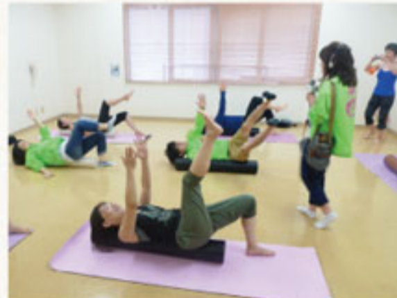
④A! ヨガサークルのみなさんとストレッチポール対決!