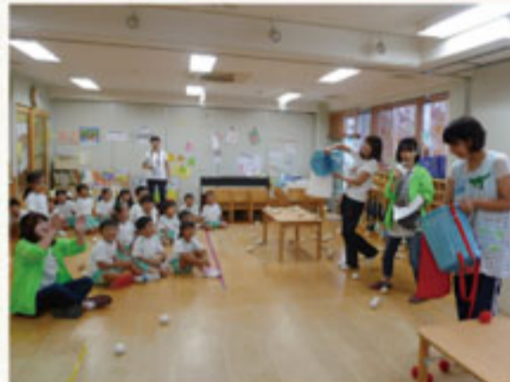
②常照寺隣保館保育園・ぞう組さんと玉入れ対決!