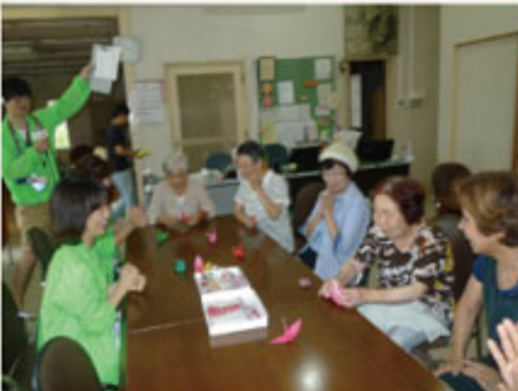
①萱野小地区福祉会のみなさんと折り紙対決