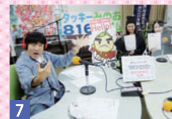
7 エール・マガジン 10/17 市民活動グループ ママ楽クラブ