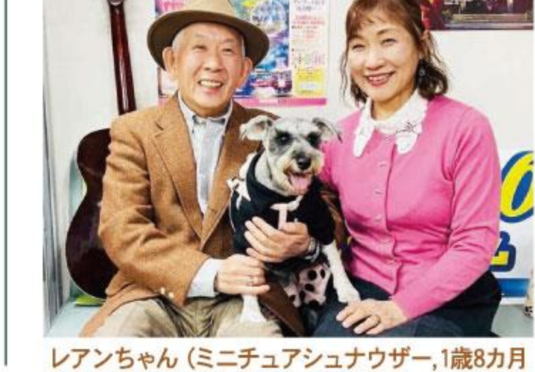
レアンちゃん (ミニチュアシュナウザー, 1歳8カ月)