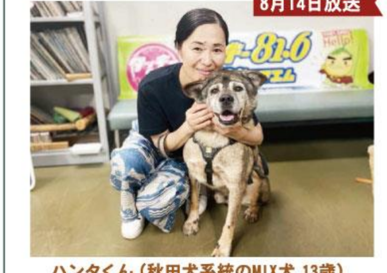
ハンタくん (秋田犬系統のMIX犬, 13歳)