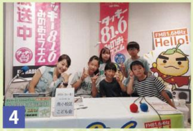
4 みのたんらじお 8月10日 南小校区子ども会のみなさん