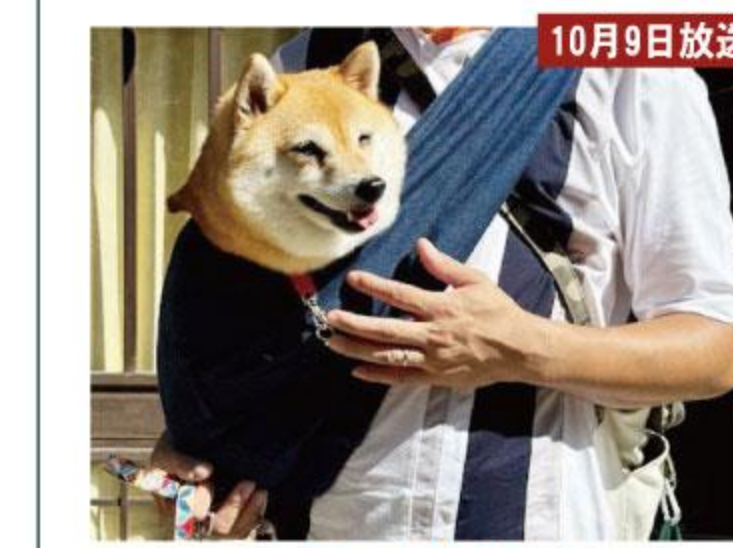
10月9日放送 バブちゃん(柴犬・5歳)

パパの抱っこで滝道を散歩中だったバブちゃん。愛知県からイベントに参加するために来阪。滝道のレストランでのランチ前でした。この日のアスファルトは焼けつくような熱さ。肉球へのダメージを考えた抱っこです。おとなしく抱っこされるバブちゃんに「いつもありがとう。長生きしてね」と話すパパママでした。