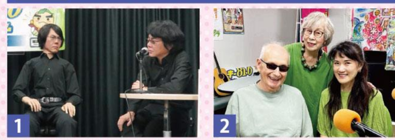
1 ハンダイラジオ 9月29日 大阪大学大学院基礎工学研究科栄誉教授 大阪関西万博テーマ事業プロデューサー 石黒浩さん(右)とアンドロイド