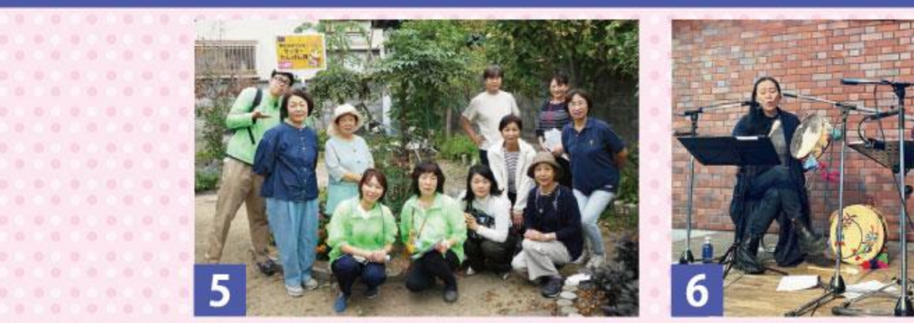
3 みものらんじお 10月12日 北小学校区子ども会のみなさん