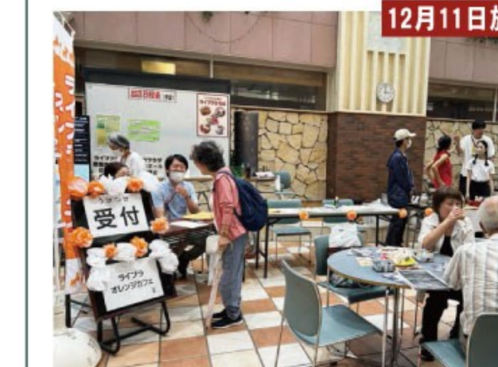
過去のライブラオレンジカフェ

認知症の人やその家族などが、相談や情報交換する「オレンジカフェ」。同席を依頼され、自分の経験談も交えつつ専門職と相談者の間を取り持ちました。相談者からは「来て良かったー!」との声も。情報を得られると安心できるので、不安な方は一人で悩まずに、ぜひ参加を!