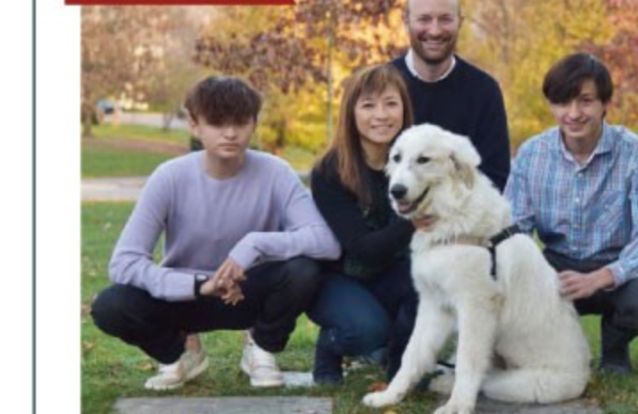
マッディーちゃん (グレート・ピレニーズ/4歳6カ月)